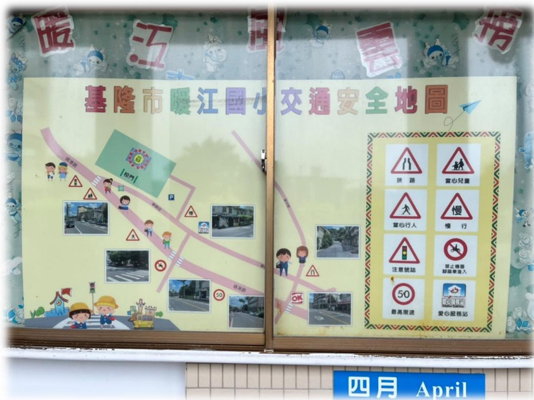
照片四說明：學生於課間活動時間於安全地圖前，觀看並討論校園周邊交通安全。