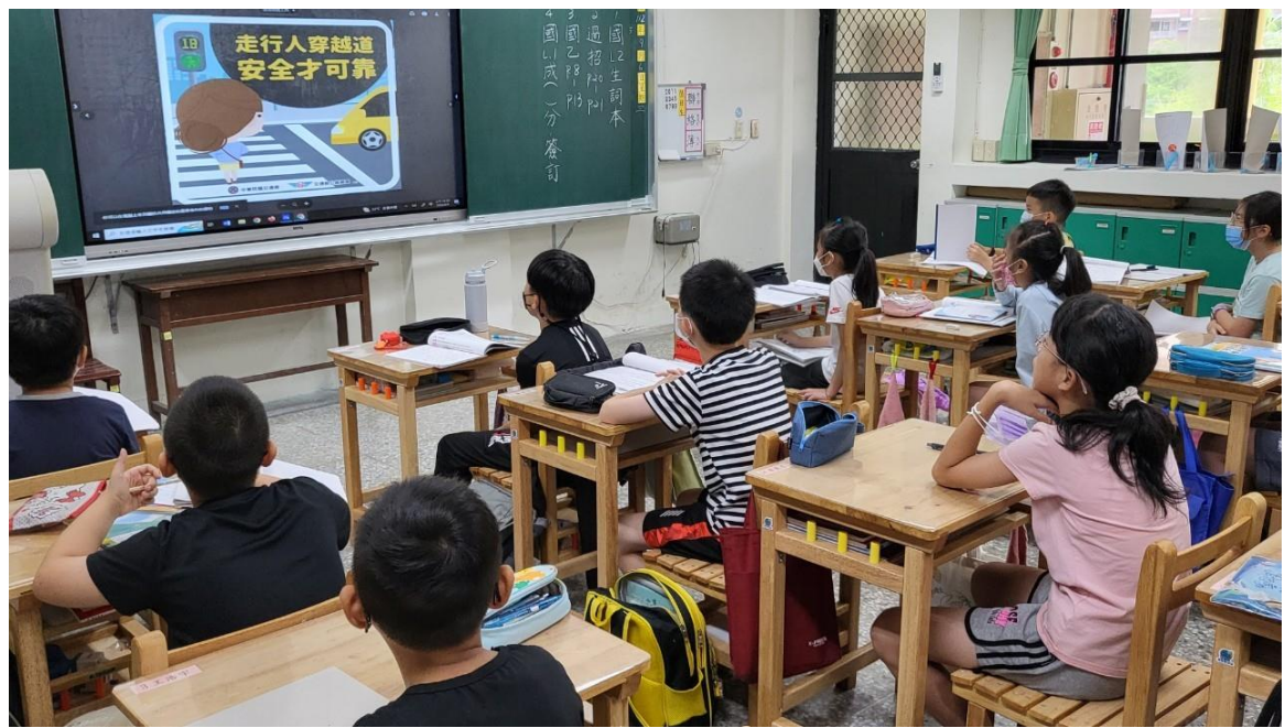
照片四說明：行前導師先進行活動說明