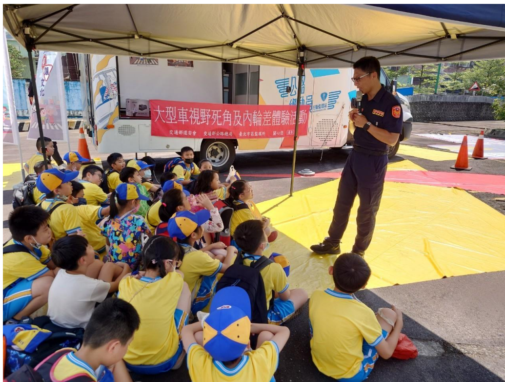
照片二說明： 至監理站進行「大型車視野死角及內輪差」體驗活動