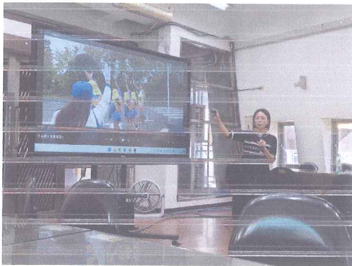
照片 3 說明：日本教導兒童行人安全示範影片