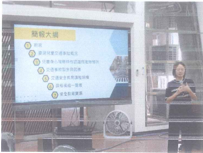
照片 1 說明：課程介紹