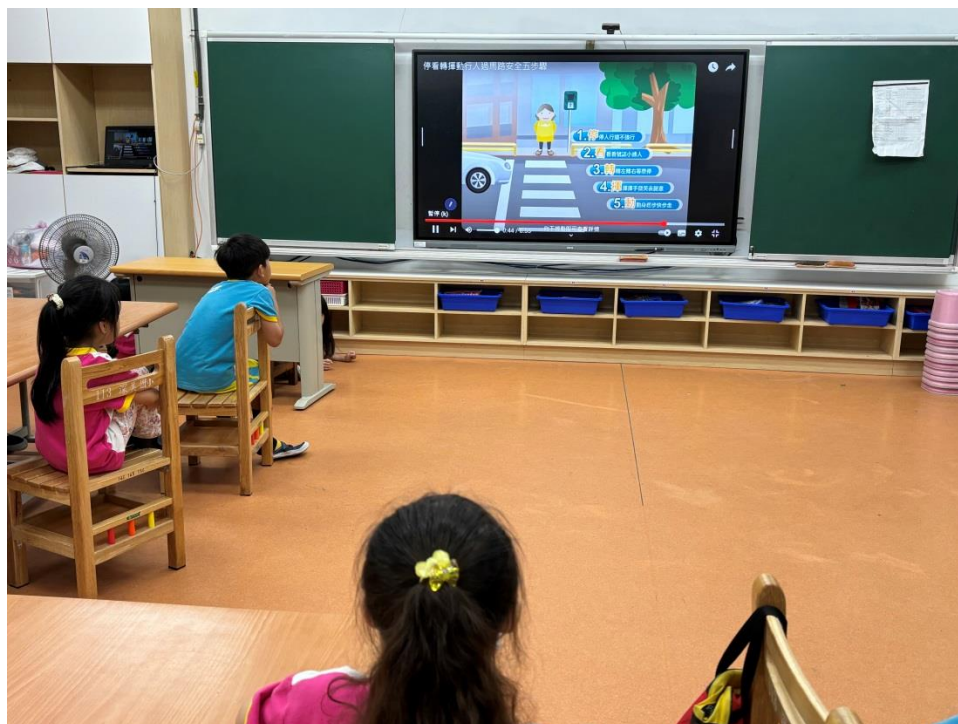
觀看影片，學習「停看轉揮動」行人過馬路安全五步驟