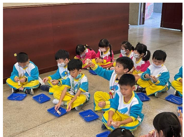
學生動手做線軸車。