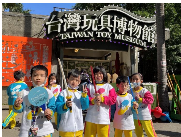
學生體驗古早木製玩具。