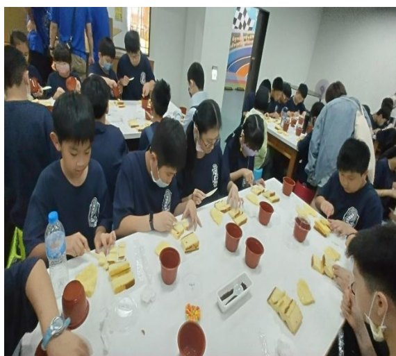
努力完成盆栽蛋糕