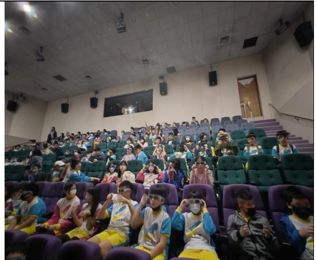
身歷其境的立體劇場