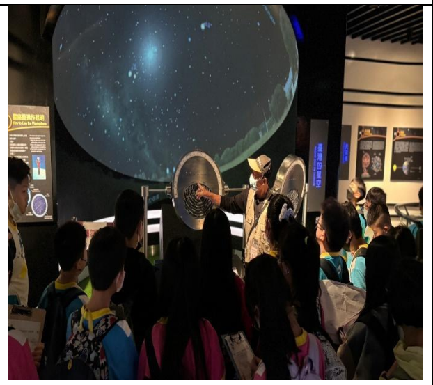
專心聆聽老師介紹星座盤