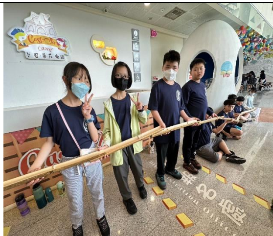
可愛的我們準備比賽了