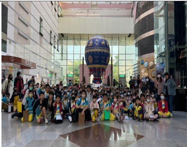
科教館地標 - 熱氣球