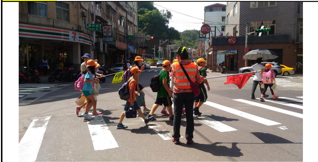
活動說明： 志工協助導護值勤重要路口，確保學童放學安全。(北寧路口)